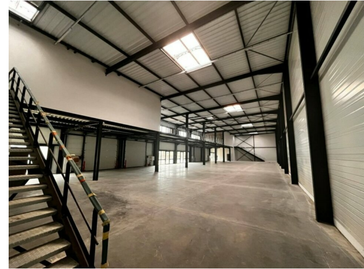
Batiment B Int