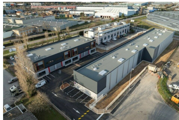
Vue Aérienne LE CONFLUENT