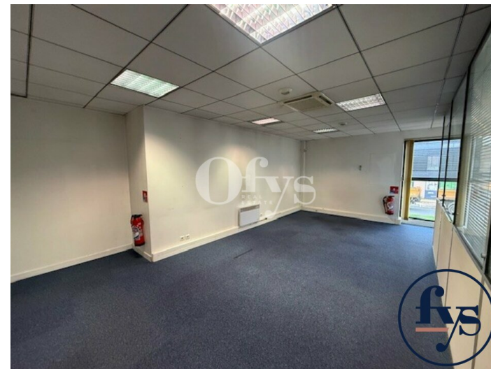
salle de réunion