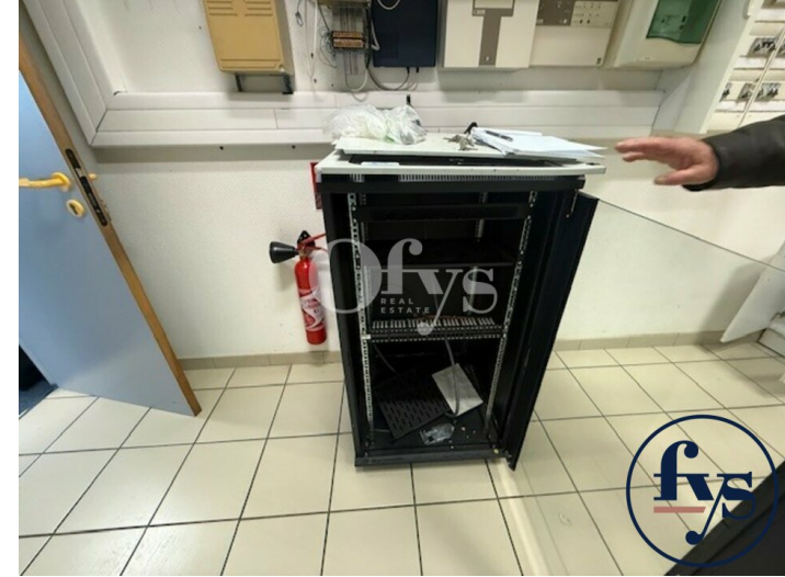
baie de brassage