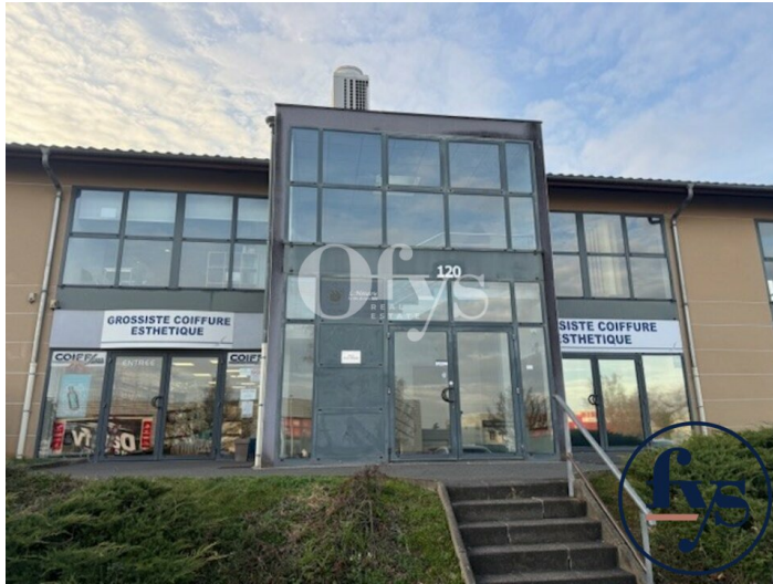
Entrée depuis parkings