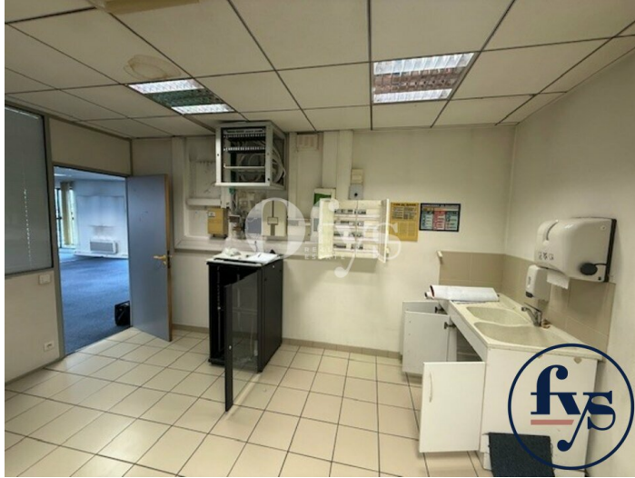
salle de pause plus arrivée baie de brassage